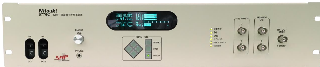
(写真は MODEL 5776C FM 同一周波数干渉除去装置です)